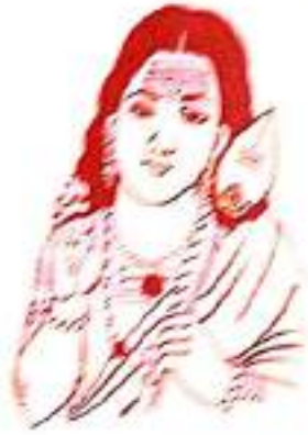
முருகக் கடவுள் துதி

அஞ்சுகழகம் தோன்றில் அஹுமுசும் தோன்றும் வெஞ்ச யில் அஞ்சாலா வேல் தோன்றும்-நெஞ்சில் ஒருகால் நினைக்கீர் திரகாலும் தோன்றும் முருகா னன்றோ துயார் முன்